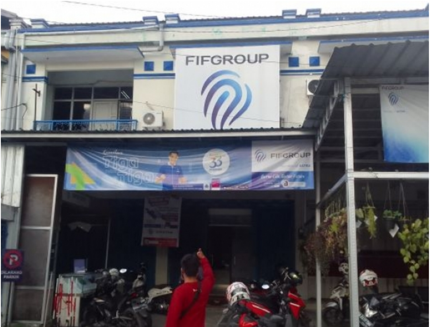
Kantor. FIF Group Di Jalan RTA Milino Kota Palangka Raya

PALANGKA RAYA - Kembali berulah, depkolektor PT Fideral Internasional Finance Group (FIFI Group), merampas dan memaksa mengambil unit motor milik konsumennya.